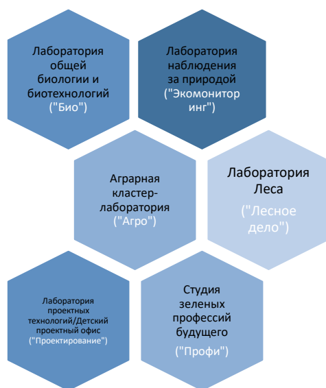
Рис. 3 Лабораторные пространства

Ни один из предложенных выше вариантов оформления лабораторных пространств не является обязательным для Экостанции, а рассматривается как примерный и рекомендуемый.